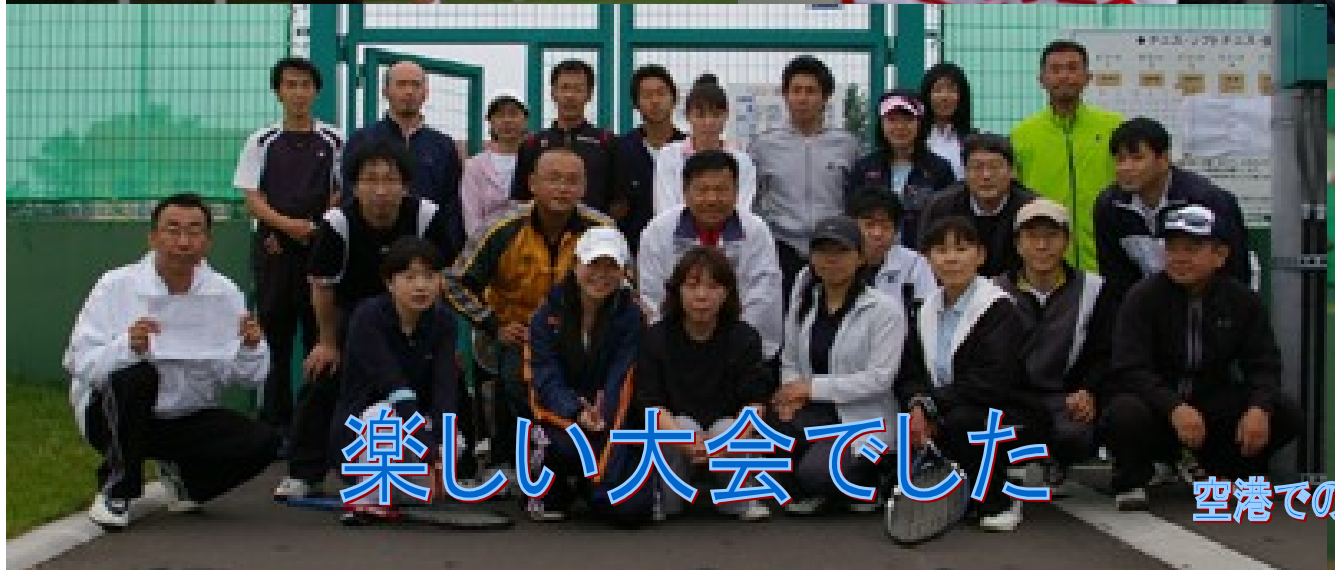
楽しい大会でした