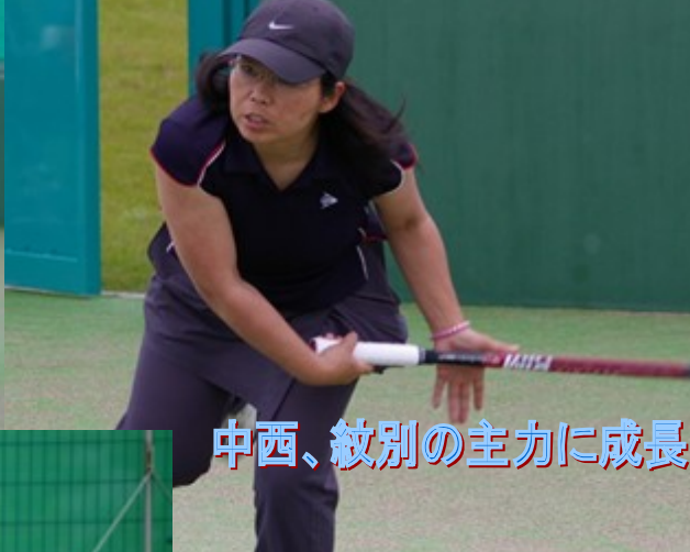
中西、紋別の主力に成長