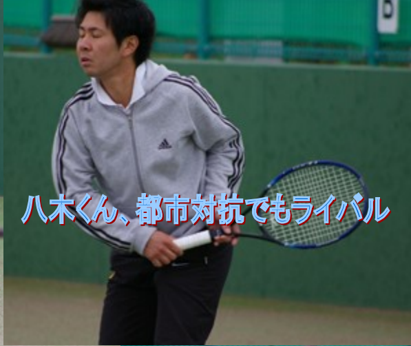
八木くん、都市対抗でもライバル