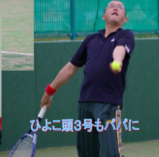
ひよこ頭3号もパパに