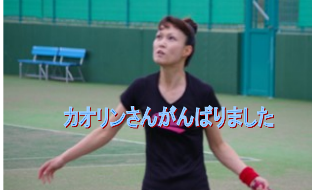
カオリンさんががんばりました