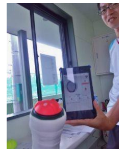
何故か、レポートを提出しません